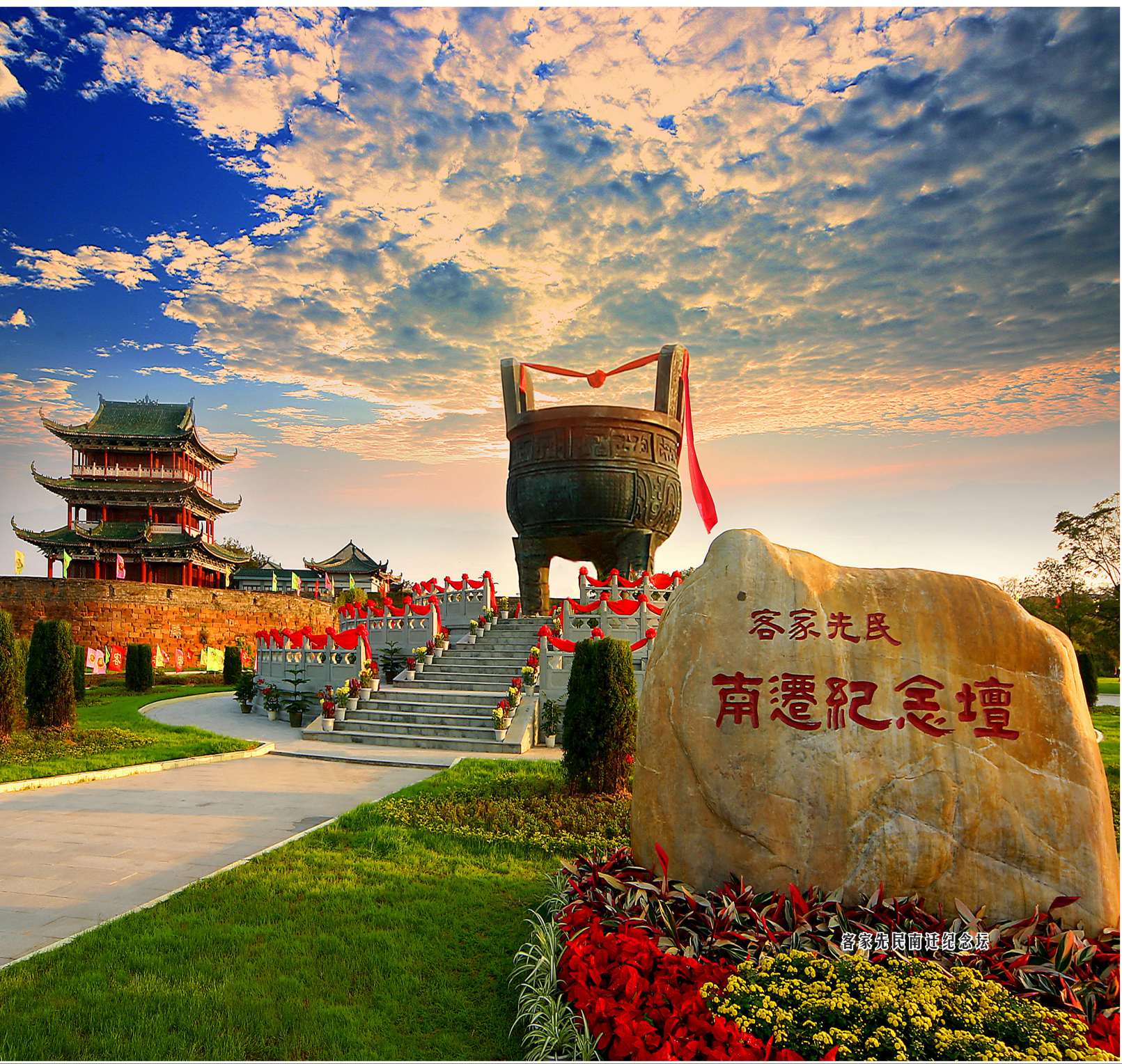
客家先民南迁纪念坛