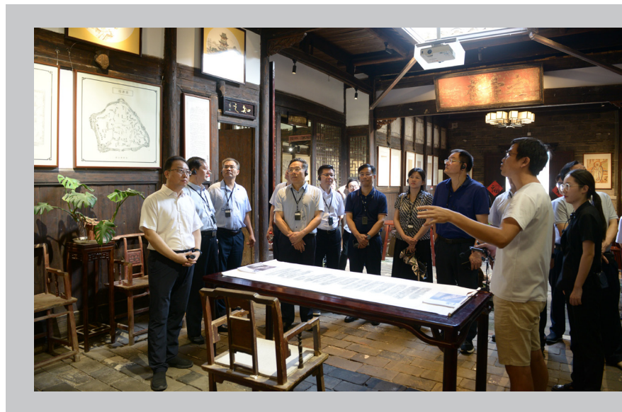
委员们在江南宋城历史文化街区视察，现场感悟深厚的赣州历史文化。

会议指出，中共界别委员在政协组织中肩负着特殊的责任和使命，要充分发挥中共界别委员先锋模范作用，不仅要履行委员职责，更要履行党员职责，在“书香政协”建设上也要带头走在前列、作出表率。要继承和弘扬政协注重学习的优良传统，持续发挥读书在增进思想共识、促进履职实践中的重要作用，不断扩大委员读书的社会溢出和示范效应，努力在以学铸魂、以学增智、以学正风、以学促干，不断提升建言资政、凝聚共识的质量和水平。